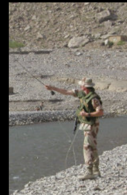
Er man en dedikert fluefisker, er det vel ingen grunn til ikke å prøve fiskelykken selv om man er i Afghanistan!

Fellesskapet i MKF (og KBS før det) har vært viktig når flytting og andre forhold har gjort det vanskelig å finne sivilt fellesskap eller gå fast i en menighet. Kristent fellesskap med kollegaer som selv kjenner det å tjenestegjøre i Forsvaret er også viktig for å luften spørsmål og forhold knyttet til fag-tro. Det å ha et kristent fellesskap i utenlandstjeneste er viktig og der kommer det internasjonale nettverket til sin rett. Internasjonalt kristent fellesskap har jeg hatt både faglig og trosmessig nytte og glede av helt siden jeg var plikttjenestebefal på Ørland