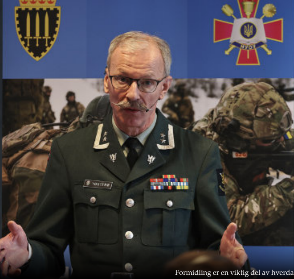
Formidling er en viktig del av hverdagen.

En skal være litt forsiktig med slagord. Det kan være noe mellom linjene som gjør at det som tar seg fint ut i promotering ikke tåler for mye kritisk vurdering. Når det gjelder å beskytte oss mot krigens ondskap, så krever det også konkretisering av de verdiene vi står for inn i krigsforberedelsene, som ved utdanning og trening av soldater og offiserer. Faren for å bli fortært av våre egne destruktive krefter er noe det advares mot allerede i Iliaden, der krigeren og halvguden Akilles fortæres av sitt eget hat. Vi som kristne har forankret verdiene våre i en autoritet utenfor oss selv, i Gud og Ordet til oss. Det er ikke opp til oss mennesker å relativisere det femte bud fordi det passer oss. Selv om vi som soldater har det å slå i hjel som oppdrag gitt av staten, gir også den kristne etikken temmelig klare rammer for når det er lov og hvordan drepingen skal begrenses og rammes inn. Det gjelder i første rekke for å beskytte ikke-