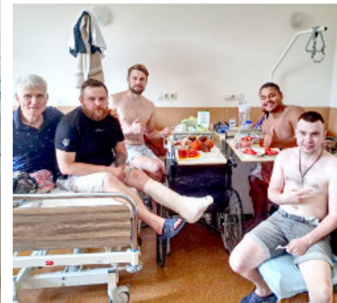
Besøk hos sårede soldater på et sykehus i Kyiv.

For eksempel har Ukrainas baptistunion mer enn 400 frivillige feltprester. Vi betjener soldatene ved fronten, på sykehusene, på basene og også familiene til de falne der det er en mulighet. Med takk ser vi at mange soldater og familiene deres er åpne for å ta imot evangeliet.