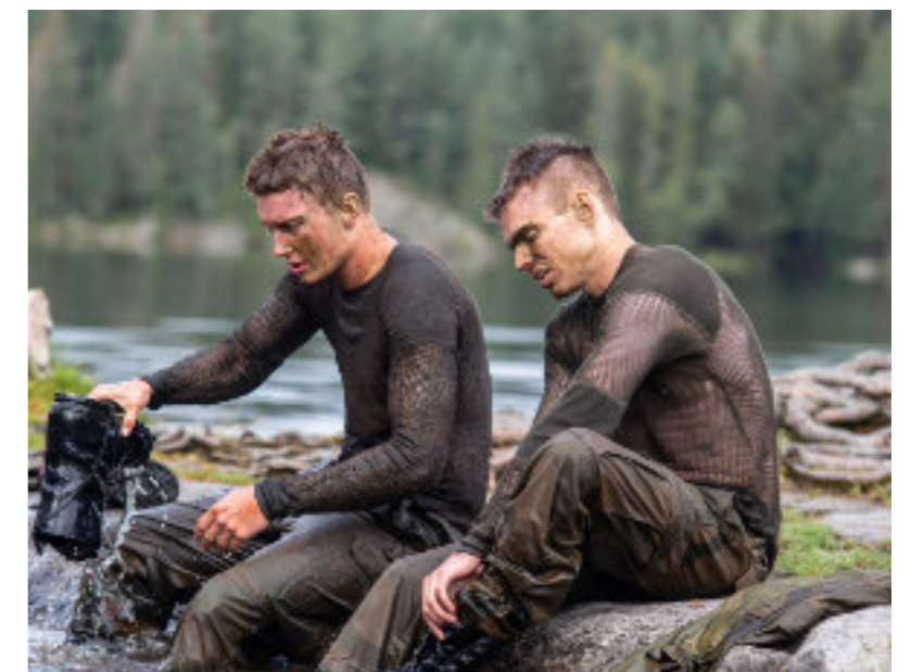
Soldater under mestringsøvelse.

Innleggene for Tro og tjeneste er tilgjengelig på MKFs podkast.