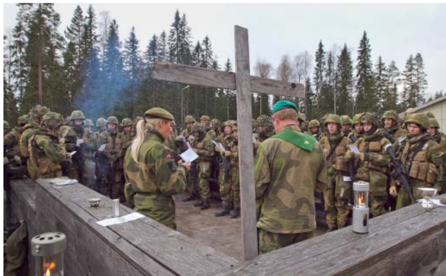
Feltgudstjeneste for Kampeskadronen/Hærens taktiske treningssenter i Rødsmoen øvingsfelt.

– Å oppleve flere feltprester i praksis ga meg et unikt innblikk i det brede spekteret av feltprester som faktisk ikke bare er på forskjellige leirer i Norge, men også innad i samme leir.