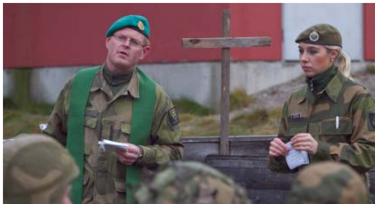
God veiledning i tjenesten med korset i sentrum....