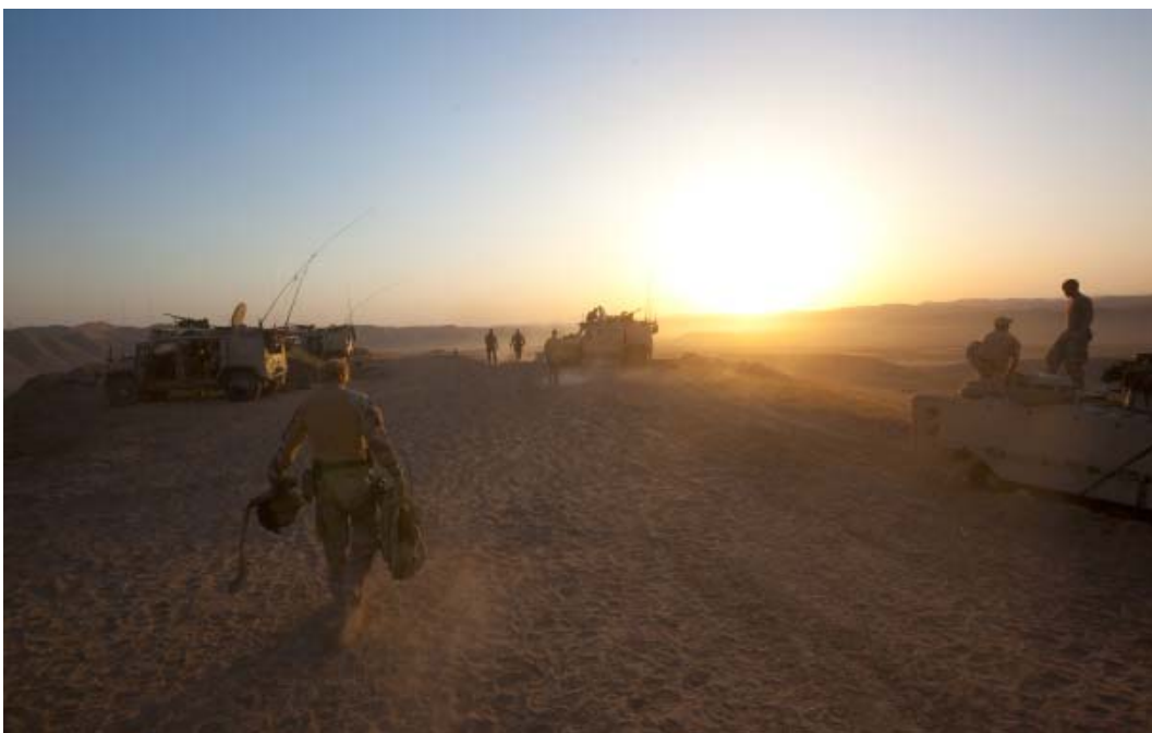
En tidlig morgen i Afghanistan.

Den siste tidens hendelser viser med all tydelighet behovet for et fast, normativt etisk verdigrunnlag i Forsvaret. Her vil vi gjerne bidra med de verdier som har ligget til grunn for fremveksten av vår sivilisasjon – de kristne grunnverdiene. Vår etiske integritet, operasjonenes legitimitet og graden av suksess avhenger av dem.