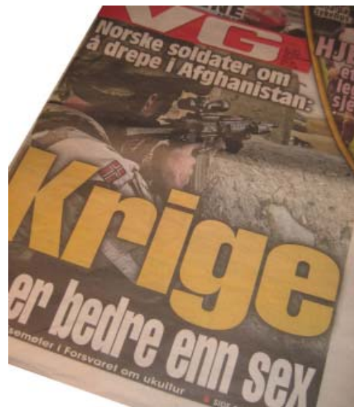
VGs forside mandag 27 september

VG mandag 27. september traff forsvarsledelsen og alle oss andre rett i ansiktet. Krig er bedre enn sex – bokstavelig talt med krigstyper over hele forsiden. En soldat i Afghanistan og hans kompanisjef fra Mek kp 4 i Telemark bataljon hadde uttalt seg til et nytt pornoblad. Realitetene på bakken i Afghanistan frontkolliderte med et vagt og manglende verdigrunnlag i Forsvaret.