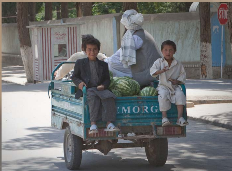
Hverdagsbilde fra Afghanistan.