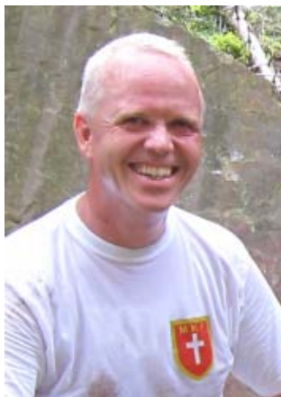
En svett - men fornøyd reisesekretær under årets Drangedal leir.

Årskonferansen blir uansett i Østlandsområdet neste gang.