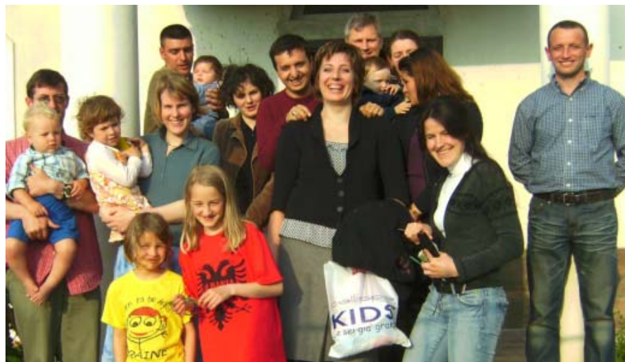
En del av gruppen for militære kristne familier som samles i Tirana en lørdag hver måned

Noen hilsener til MKF fra albanske militære, skrevet inn i et av Nytestamentene