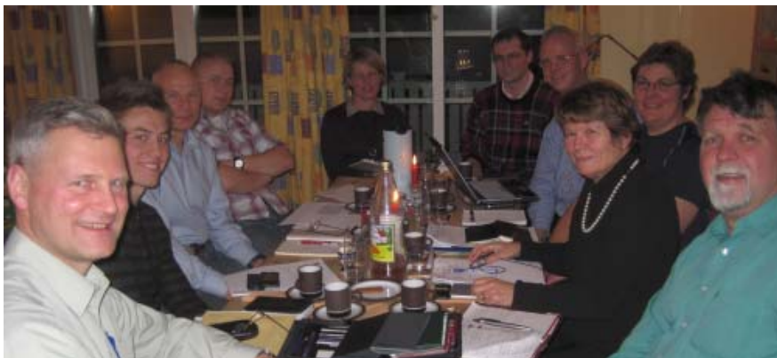
Styret var nesten fulltallig på siste styremøte den 13 nov