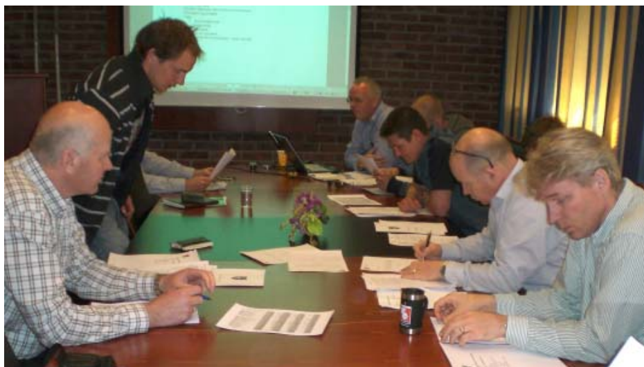
Konsentrerte deltakere rundt bordet under årsmøteforhandlingene

Vår nettside ( www.mkf.no ) er nå i drift, med Christian Filberg som ansvarlig redaktør. Det kom opp-