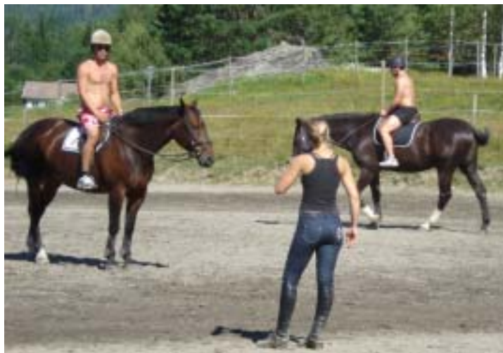
Deltakerne fikk også prøve seg på ridning under kyndig veiledning

Søndag hadde vi igjen en bra fellesfrokost, før vi drog opp på et fjell hvor vi hadde en delegudstjeneste. Mange ønsket å dele, og vi fikk mye bra lovsang. Etter gudstjenesten ble