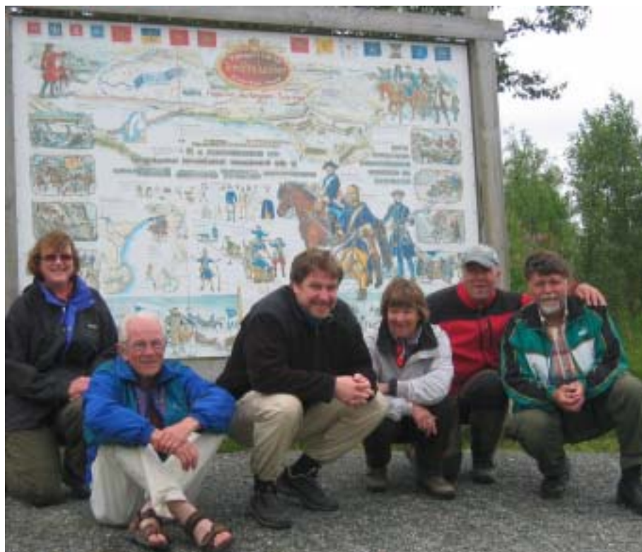
Deltakerne samlet ved start i Duved.

Hvordan bruker vi våre fridager og ferien? For min del så er en av mine prioriteringer turer og friluftsliv; gjerne alene, for da kan jeg ha den farten jeg føler for i øyeblikket og ha ro med mine egne tanker.