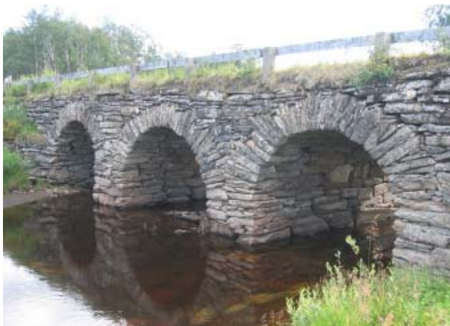
En av de mange steinbroene langs Karl Johans-vägen i Jämtland

Under vandringen var det salmen «Takk gode Gud, for alle ting» vi brukte mest, og under siste delen var vi ofte inne på lignelsen om hyrden som forlot sine 99 sauer i trygghet for å lete opp den ene som han savnet. Gud er glad i hver eneste en av oss mennesker. Jeg hilser med Joh. 3.16..