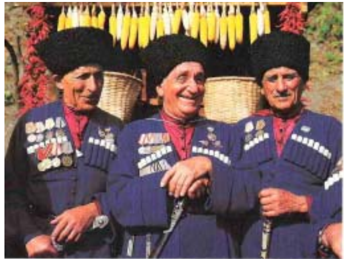
Noen blide sangere i Tbilisi.

I denne, som i en rekke andre konflikter blir det nødvendig å søke seg mot den nøkterne og analytisk åpne innfallsport som første tiltak for å bidra til en nedskalering av konfliktnivået. EU, OSSE og FN synes