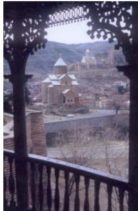
Gamlebyen i Tbilisi.

Utbryterrepublikkene Sør-Ossetia og Abkhasia utgjør ingen uvesentlig faktor i dette bildet. Begge regioner er folkerettslig å anse som en del av Georgia. Forholdet i dag er imidlertid det at innenfor er et flertall av etniske sør-ossetere og russere og med et ikke ubetydelig mindretall av etniske georgiere for Sør-Ossetias vedkommende, og et flertall av abkhasere og russere i Abkhasia med et betydelig antall av etniske georgiere. Som sådan komplimenterer situasjonen her det som med trygghet kan kalles et kaukasiske lappeteppes av nasjoner slik det opp gjennom tider har vært ulike makt-konstellasjoner som har gitt en konsekvens av større eller mindre