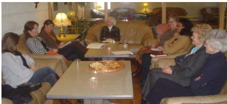
Under årsmøtet hadde damene en egen samling.

Selve årsmøtet på lørdag ble aktivt og engasjerende, selv om vi denne gangen ikke hadde tunge saker til debatt – slik som i fjor. Av de sakene som ble drøftet var spørsmålet om å videreføre de satsingsområdene som vi nå har hatt et par år, og en utvidet informasjonsvirksomhet overfor våre medlemmer og støttemedlemmer ved bruk av e-post. Styret ønsker f.eks. ikke å utgi flere papirutgaver av medlemslisten, og den finnes nå alltid tilgjengelig og oppdatert i elektronisk form for medlemmer som ønsker det. Et forslag om å innføre et betalt abonnement på Fokus for mottakere som ikke er medlemmer ble nedstemt. Fokus skal fortsatt være gratis for alle!