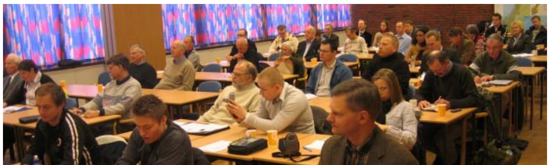
Det var mange oppmerksomme tilhørere på foredraget til Opperud

Til slutt må jeg understreke at Afghanistan er et mannsdominert samfunn. Det anbefales f.eks. ikke å sende kvinnelige feltprester dit.