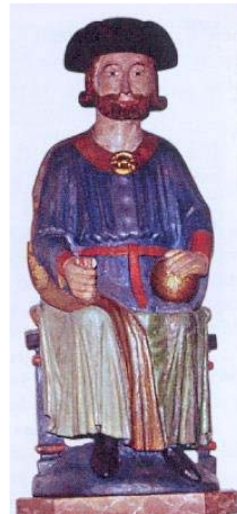
I Åre gamle kirke står denne spesielle Olavsfiguren fra 1300-tallet. Kongekronen ble byttet ut med karolinerhatt, sannsynligvis av en karoliner som var med i felttoget i 1718.

Vandringen foregår i ca 12 dager, dvs i tiden 9-22 august . Vi regner med å reise med tog til startstedet 8 aug, og overlater til den enkelte å vurdere egen reise hjem fra Trondheim. Kostnadene blir ca kr. 300,- pr døgn for overnatting og mat. Vi overnatter på enkle herberger og lager maten selv. Hver dagsetappe er på ca 20 km, totalt 240 km.